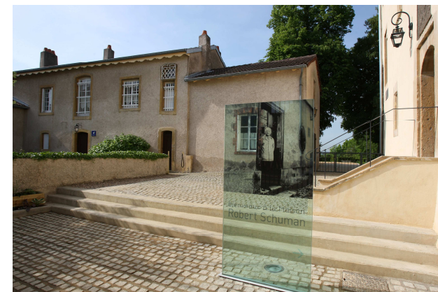
Maison de Robert Schuman - Maison historique vue de la cour intérieure